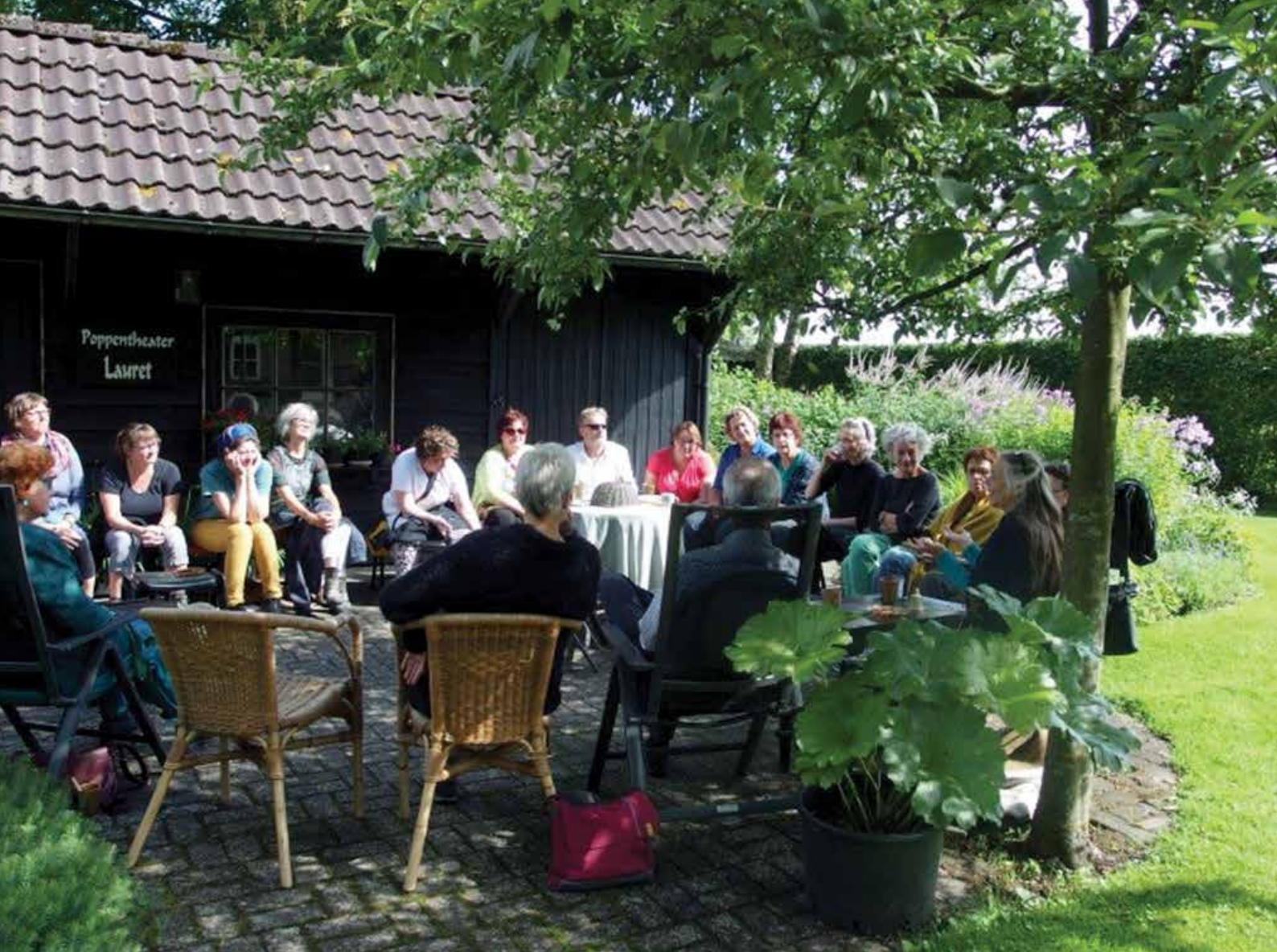
Afsluitingsdag van het POPU